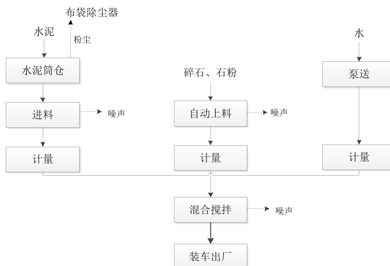
图 2-3 水泥稳定土层生产工艺流程及产污环节