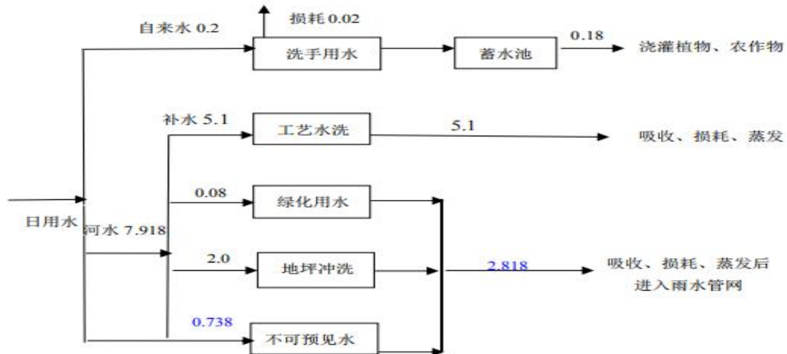
图 2-1 项目水平衡图

项目主要用水为生活用水、喷雾抑尘用水、洗车用水, 本项目生产用水全部来源于河水供给, 生活用水为自来水, 能满足项目生产、生活用水。